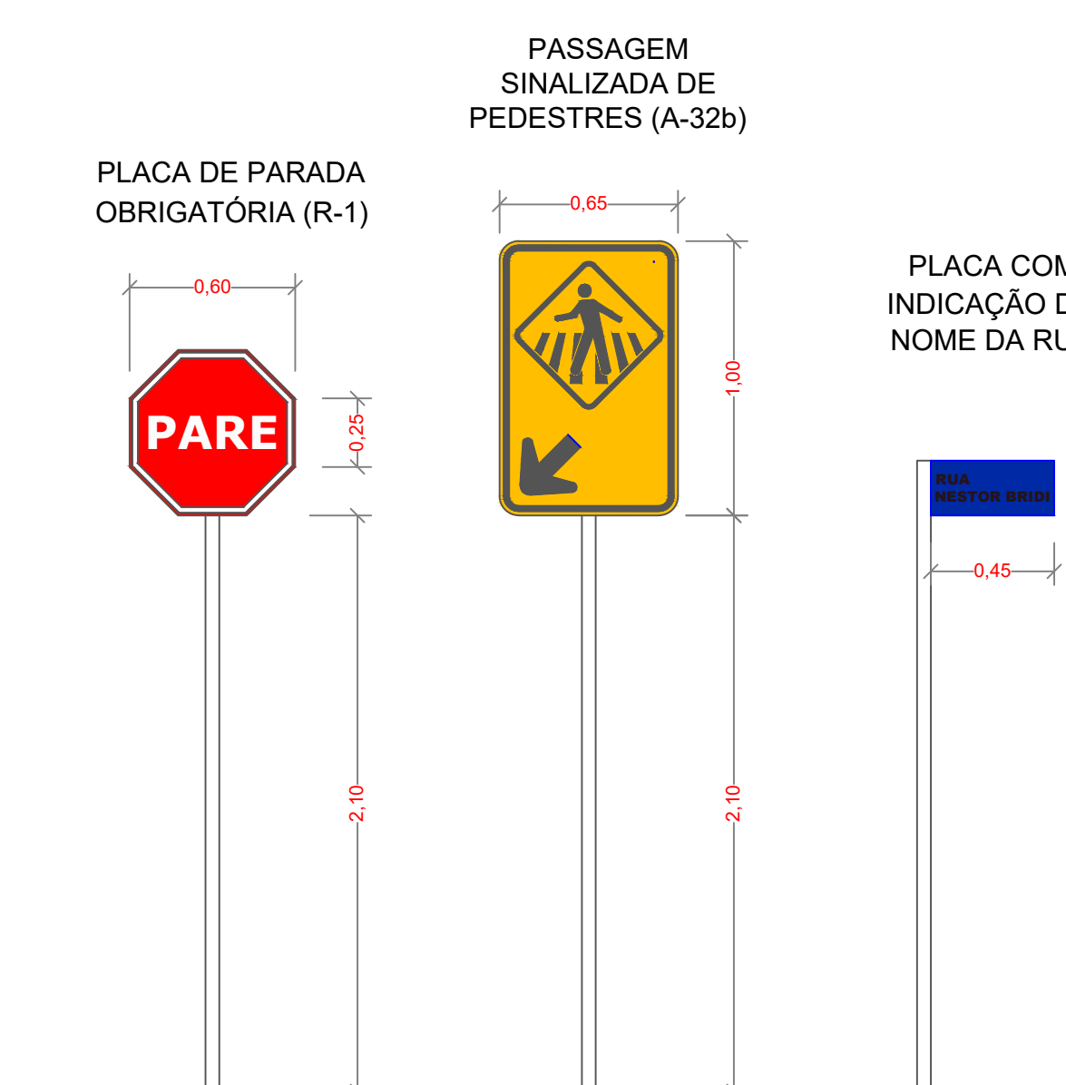
Placas de Sinalização | Escala 1/25

*Todas as placas serão em aço galvanizado com pintura eletrolítica